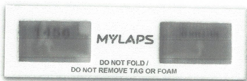
Σχέδιο chip χρονομέτρησης