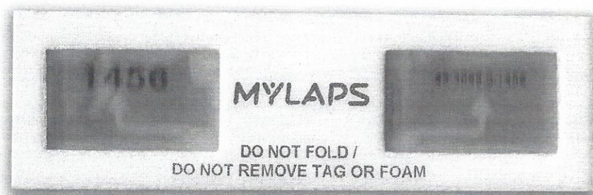
Σχέδιο chip χρονομέτρησης